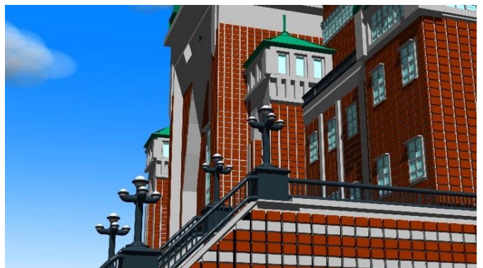
図 6：深谷市郷土 PR 部門・深谷市長賞 作品名「ふるさと」 矢島 佳典（埼玉県立熊谷西高校）