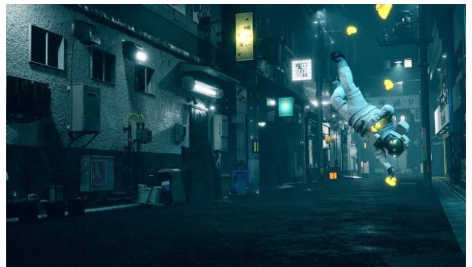
図 5：15 周年記念部門 優秀賞 作品名「無重力アヒル」 二藤部 真世（社会人）