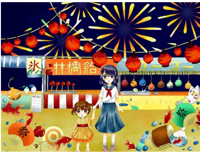
図 3：中学生静止画部門 優秀賞 作品名「あの日の夏祭り」 郷 莉緒（帝塚山中学校）