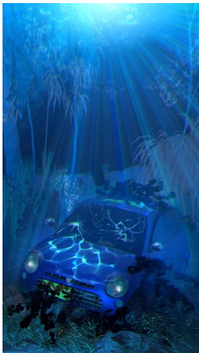
図 4：学内静止画部門 優秀賞 作品名「まとう ～車の見た夢～」 濱本 光翔利（本学 人間社会学部情報社会学科）