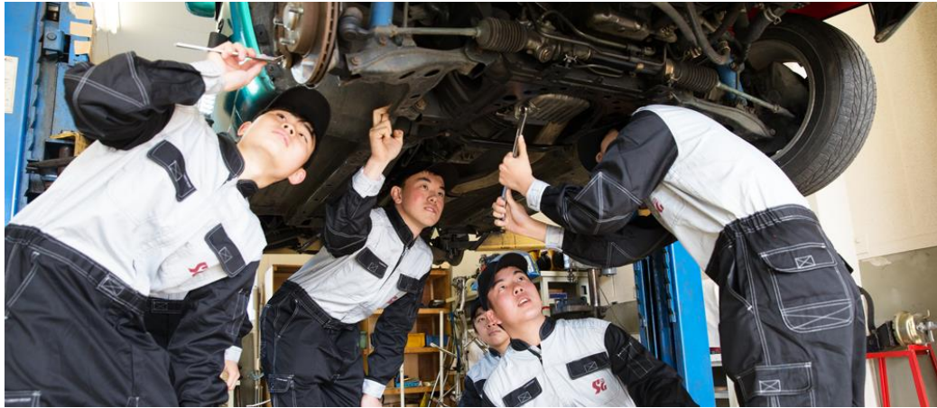
《清和学園高校自動車科の風景》