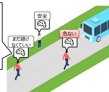
危険認知AIを使って、歩行者にとって安心な 走行条件をデジタル空間上でシミュレーション