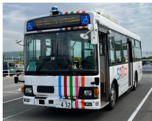
<写真：使用車両の大型バス>

本年度の特徴としては、愛・地球博記念公園において、大型バスによる自動走行を初めて実施します（園内バスと同型のバスを使用。）。また、AI映像解析技術 ※2 を活用し、園内の歩行者に対して音声によるバスの接近の注意喚起を行います。さらに、複数のカメラ映像を5Gにより伝送し、遠隔管制 ※3 者がルート上の危険を検知し、遠隔管制室と車両との間でコミュニケーションを取り、事故等を防ぎます。その他にも、車両と歩行者の動きに関するシミュレーションを行い、自動運転バスと歩行者の安心・安全な共存の在り方を検証し、将来の園内における自動運転サービスの実装を目指します。